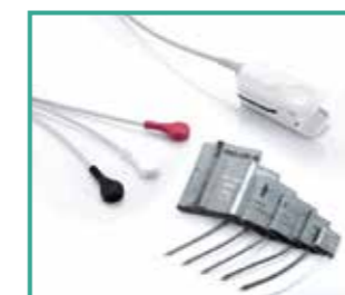
Accesorios de alta calidad