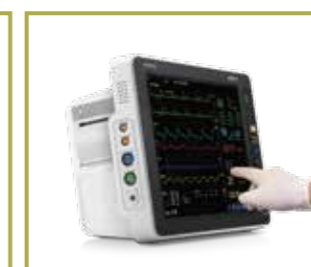
Interfaces fáciles de usar