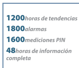
Enorme capacidad de datos