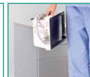
Protección contra caídas