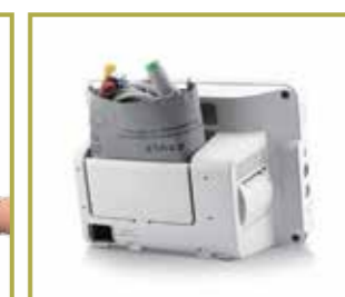
Gabinete exclusivo para accesorios