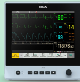
serie X Monitor de Paciente